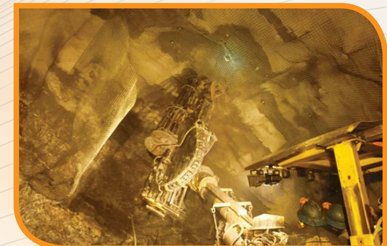
Instalación mecanizada de malla con Hydrabolt