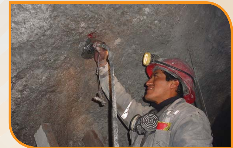
Instalación manual del Hydrabolt

Los pernos de anclaje Hydrabolt son de alta tecnología, de gran trabajabilidad y considero que son los anclajes de última generación; que aportan dos ventajas: seguridad y productividad.